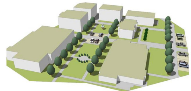
Projekt Bad Kösen

Mehrgenerationenwohnanlage in Sachsen-Anhalt Architekt: J. Dettbarn-Reggentin