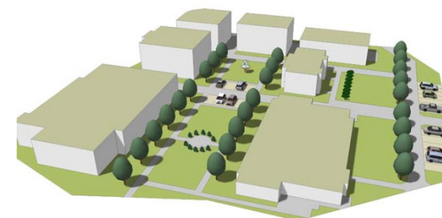
Projekt Bad Kösen

Fr. 25.10.2024 in Weimar Sem. Nr. 24 207 B